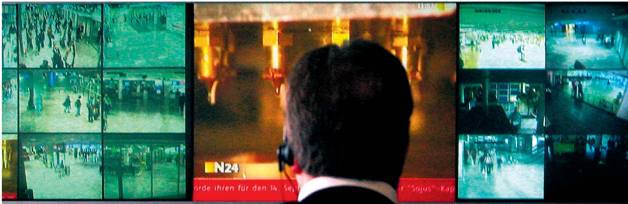
Het meest zichtbare effect van de aanslagen van 11 september 2001 is de verscherpte controle op veiligheid op luchthavens. Hier houdt een bewaker het vliegveld van Frankfurt in de gaten.