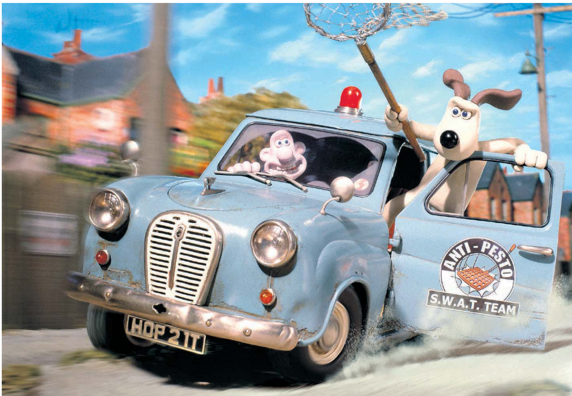
De meest recente animatiefilm van filmmaatschappij Dreamworks SKG, 'Wallace and Gromit in The curse of the were-rabbit'. Concurrent Paramount neemt Dreamworks over.