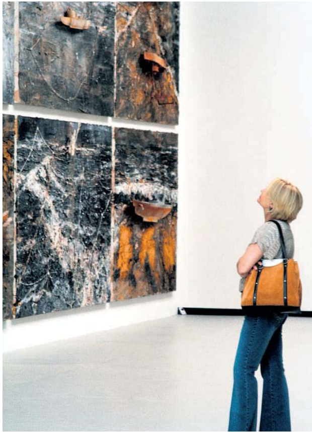
Schilderijen van Anselm Kiefer in Ridgefield, Connecticut