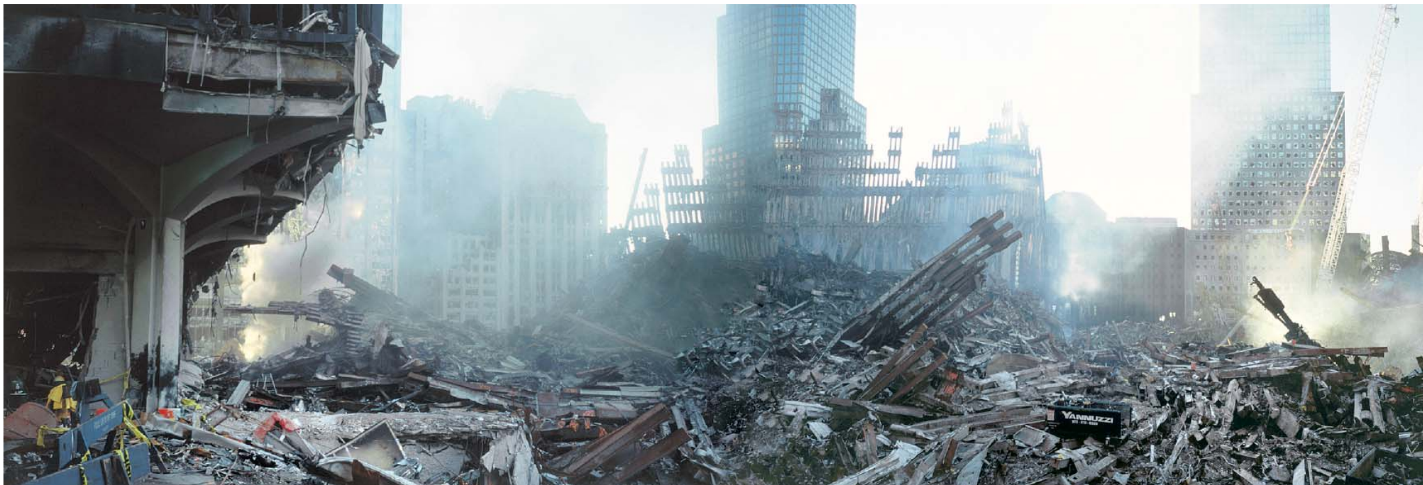
'Assembled panorama of the plaza, looking south and west', 2001