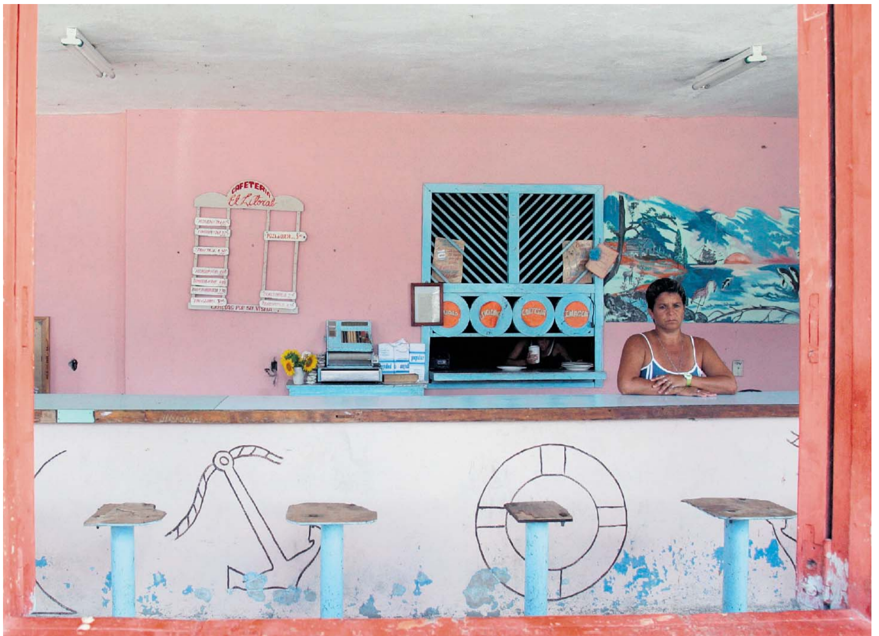
De eigenaresse van een cafeteria in het Cubaanse Isabela Nueva wacht op klanten. Cuba is nauwelijks een handelsnatie te noemen, maar de Cubaanse toeristensector heeft groeipotentieel. Vorig jaar was Cuba volgens de Caribbean Tourism Organisation goed voor 2,3 miljoen overnachtingen. Inkomsten: 2 miljard dollar.