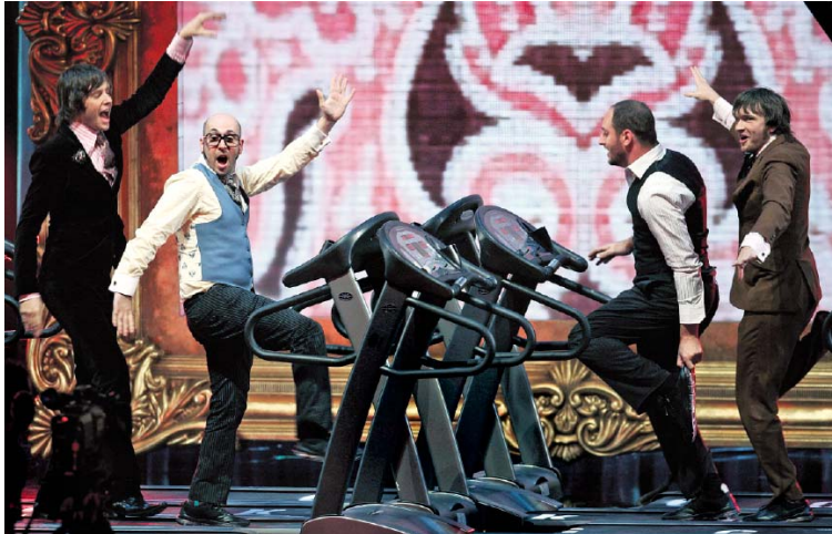
De rockband OK Go, uit Chicago, werd bekend dankzij Youtube. Hun videoclipen werden daar miljoenen keren bekeken, voor MTV ze voor het eerst uitzond.